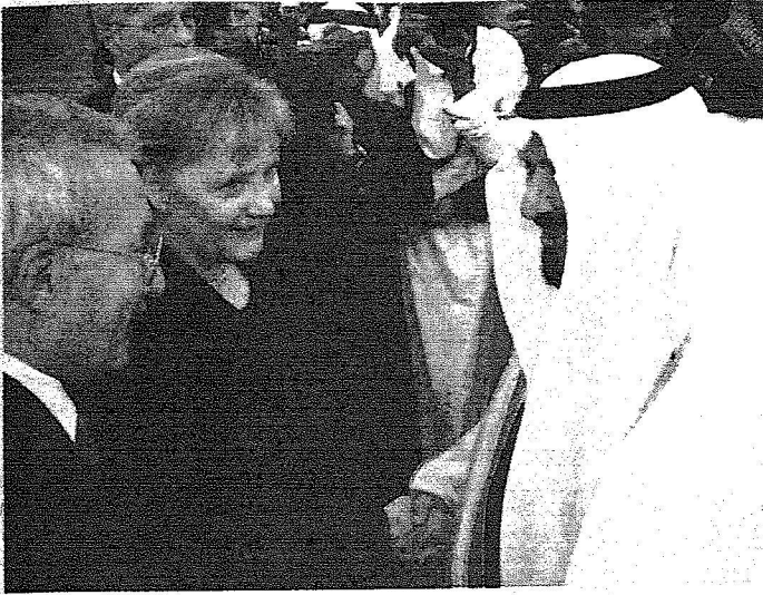
الأمير سلطان بن عبد العزيز لدى استقباله المستشارة الألمانية في المطار أمس

أنحاء العالم. وفي نهاية الاستقبال قلد خادم الحرمين الشريفين غوتيريس وشاح الملك عبد العزيز من الطبعة الثانية تقديرا لجهوده الإنسانية. وحضر الاستقبال الأمير سعود الفيصل، والأمير مقرن بن عبد العزيز رئيس الاستخبارات العامة، والأمير فيصل بن عبد الله بن عبد العزيز رئيس جمعية الهلال الأحمر السعودي.