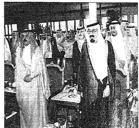
لكه عبد الله والعاقل الجبريني خلال السلام الملكي

خادم الحرمين يرمى انطلاقاً مهرجان الجنادرية .. ويسلم « هداج » كأس سباق الهجن الكبير