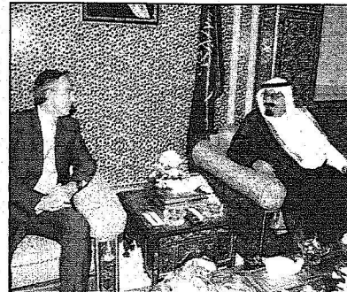
الملك يستقبل توني بلير