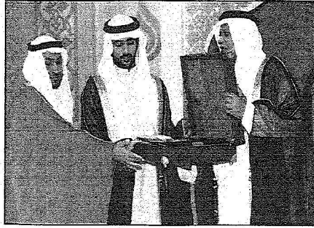
الأمين العام للمجمع مسلم ولي عهد دبي مصفياً مدينة من المجمع