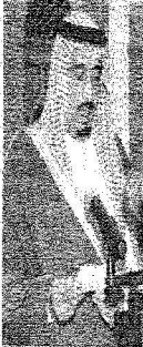
..والأمير سلمان بن عبد العزيز