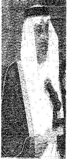
..والأمير خالد الفيصل (أول)