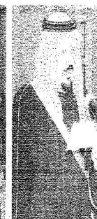
..والأمير عبد الرحمن بن عبد العزيز