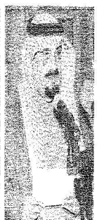
الأمير مشعل بن عبد العزيز