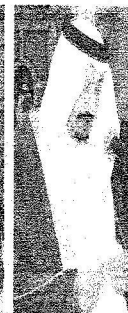
..والأمير متهيب بن عبد العزيز