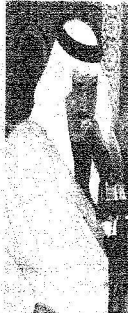
..والأمير نايف بن عبد العزيز