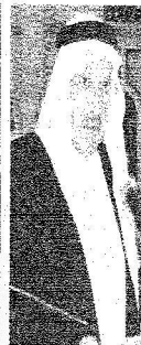
..والأمير طلال بن عبد العزيز