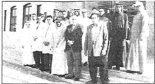
مستشفى الملك فهد بالهفوف