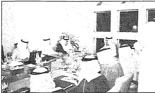
سموه خلال ترؤسه اجتماع مجلس إدارة المؤسسة (و.أ.س.)

وأشار سمو أمير منطقة الرياض وأعضاء المجلس بالريادة التي لقيتها الجامعة من صاحب السمو الملكي الأمير سلطان بن عبدالعزيز منذ كان المشروع فكرة من أهالي منطقة الرياض وما لقيته الجامعة بعد ذلك من دعم مالي من سموه - حفظه الله - منذ بداية تأسيسها وحتى اليوم مما ساعدها على التوسع في منشأتها وبرامجها العلمية.