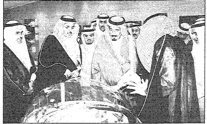
الأمير سلمان يطلع على مجسمات مشروعات المؤسسة

سموه ترأس اجتماع مؤسسة الرياض الخيرية للعلوم