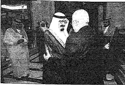
الملك عبدالله خلال استقباله الرئيس عباس