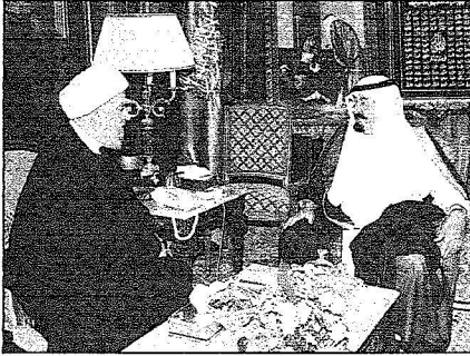
خادم الحرمين مستقبلاً الشيخ قبلان (و.أ.س)

وعاصمتها القدس وتحقيق الامن والاستقرار في المنطقة وفقاً لقرارات الشرعية الدولية ومبادرة السلام العربية. حضر الاستقبال صاحب