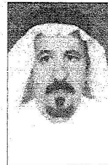
مجد كل ناهش