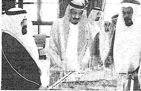
.. ويتسلم هدية تذكارية من محافظ الأفلاج