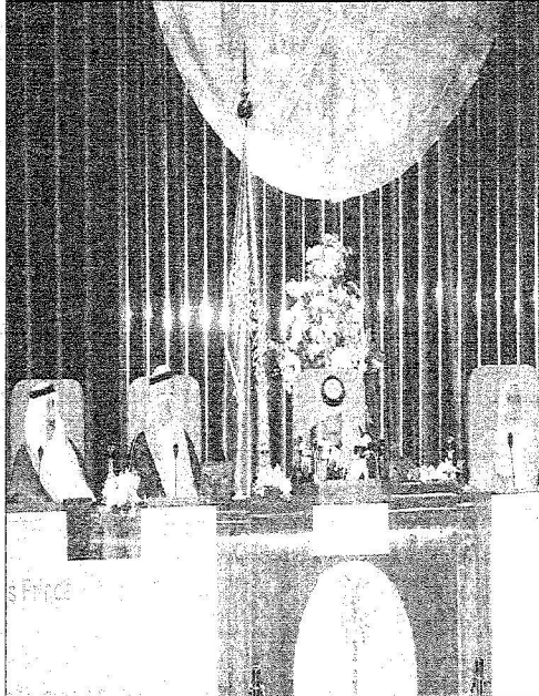
الأمير بدر بن عبد العزيز