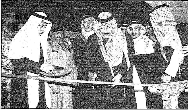
الأمير نايف يقص الشريط إيذاناً بالفتاح المعرض المصاحب

التاريخ : 12-03-2007 العدد : 14140 الصفحات : 17 المسلسل : 132