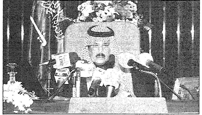
سمو وزير الداخلية خلال رعايته الحفل