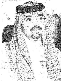
عبدالله صالح كامل