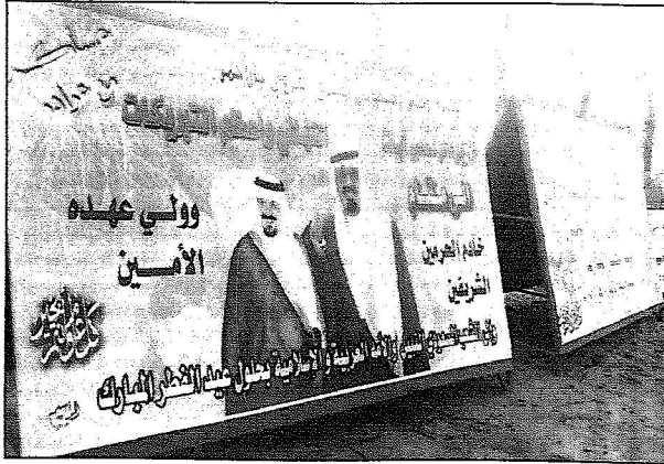
لوحات نهائي العيد في موقع الاحتفالات

العدل الثانية في الرياض ! عجابه بما يبذله المسؤولون والإهالي من مجهودات لما فيها من مصلحة وتطور المحافظة ونوه إلى أن هذه التظاهرة المعبرة عن الفرح بالعيد إنما هي تظاهرة اجتماعية متمازجة ومتلاحمة في إطار كتاب الله وسنة نبيه صلى الله عليه وسلم وشكر القائمين على فعاليات المهرجان لما بذلوه من جهود واضحة في سبيل انجاح عيد الأفلاج.