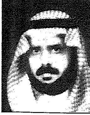
سعد بن سحيم