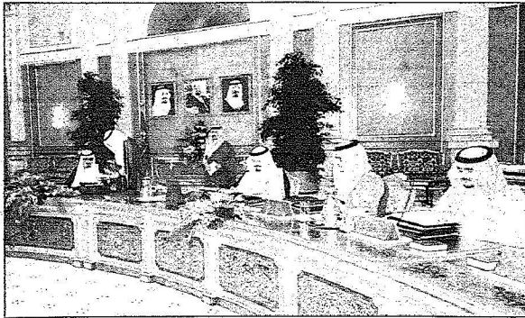
جانب من اجتماع المجلس

بعد الاطلاع على ما رفعه رئيس مدينة الملك عبدالعزيز