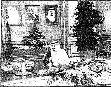
خادم الحرمين الشريفين خلال ترؤسه جلسة مجلس الوزراء أمس

وافق مجلس الوزراء على مساهمة صندوق الاستثمارات العامة في رأس مال المؤسسة الدولية الإسلامية لتمويل التجارة بمبلغ «٣٠,٠٠٠,٠٠٠» ثلاثين مليون دولار أمريكي.