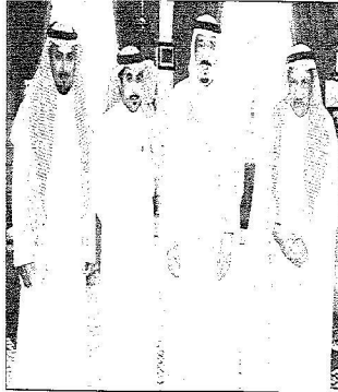
أمير الرياض خلال استقبله رئيس مجلس إدارة البنك السعودي