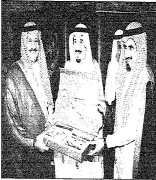
أمير الرياض يسلم الأمين خلد بن سلطان خدية تكافؤ

حكومة خادم الحرمين هيأت التنظيمات التي تتيح تطوير الأعمال الوقفية بمعايير ممتنية عالية