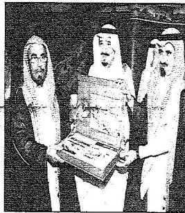
أسيار الرياض بكرم الشيخ الملحق

ويتضمن البرنامج كذلك برنامج "التطوع" الذي يبحث الطلاب والخريجين على العمل التطوعي في الجامعة وإصلاحها مثل المشاركة مع برنامج الشركة الطلابية في تنظيم فعاليات ومناسبات الجامعة، ودعم الأبحاث والبرامج الاجتماعية، والمشاركة في تطوير مرافق الجامعة لتقديم خدماتها بكفاءة أفضل.