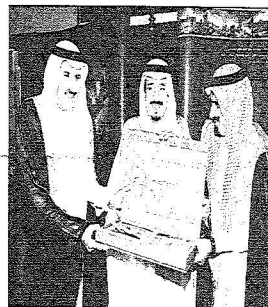
سمو ديسلم الأيمن ليعمل بن سلمان في تذكارية

بعد تلك نشن صاحب سمو الملكي الأمير سلطان بن عبدالعزيز "برنامج الأيمن سلمان للوفاء للجامعة" الذي يهدف إلى ترسيخ الشراكة والتفاعل بين الجامعة ومحبينا وأعضائها وطالبها، وتقديم فرصة لهم للمشاركة في دعم الجامعة من أجل بناء مجتمع المعرفة، إضافة إلى تعزيز العمل التطوعي.