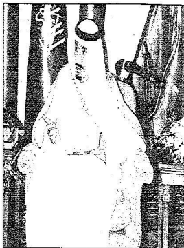
الأمير سلمان خلال الاجتماع