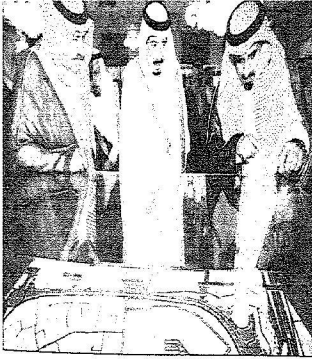
أمير سلمان بن فهد على مجسم أحد مشاريع أوقاف جامعة الملك سعود