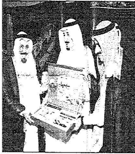
سمو بكرم وزير التعليم العالي

ويشتمل البرنامج على "صندوق وقي" يسهم في تمويل أوقاف الجامعة بعد مليون سيم فمئة كل سبعمائة ريال، كما يشتمل على "برنامج الاستفاح" الذي يهدف إلى حث الطلاب والخريجين وأعضاء الجامعة ومحبينا على تقديم التبرعات المباشرة للجامعة عن طريق الاستفاح.