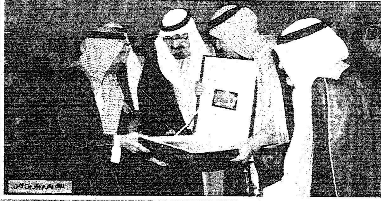
للكبير محمد بن سلمان

الأمير سلمان قائد هذا الحراك الخيري ومهندس شراكتهم «المجتمعية»