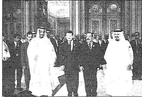
سمو ولي العهد والأمير سلمان يتوسطهما الرئيس اليمني والعميل الأردني