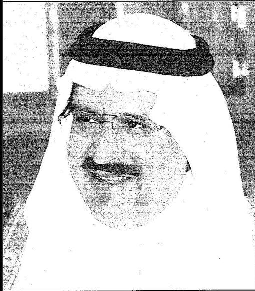
الأمير عبدالمجيد بن عبدالعزيز

محافظ الطائف فهد بن عبدالعزيز بن معمر لـ «الرياض»: