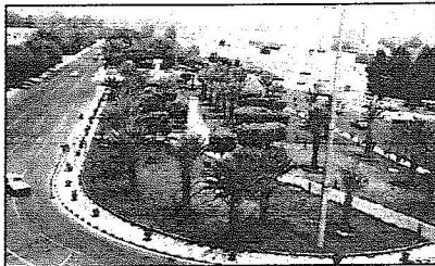
منظر من الملعب