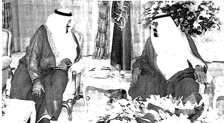
الملك وولي العهد خلال استقبالهما العلماء والمشايخ أمس.

الطائف - وأس: استقبل خادم الحرمين الشريفين الملك عبد الله بن عبد العزيز في قصره في الطائف أمس، الشيخ عبد العزيز بن عبد الله آل الشيخ مفتي عام المملكة ورئيس هيئة كبار العلماء وإدارة البحوث العلمية والإفتاء والشيخ صالح بن محمد اللحيدان رئيس مجلس القضاء الأعلى والدكتور صالح بن حميد رئيس مجلس الشورى والعلماء والمشايخ الذين قدموا للسلام على خادم الحرمين الشريفين وتهنئته بسلامة الوصول إلى الطائف. وفي بداية الاستقبال أُنصت الجميع إلى تلاوة آيات من القرآن الكريم مع شرحها وتفسيرها.