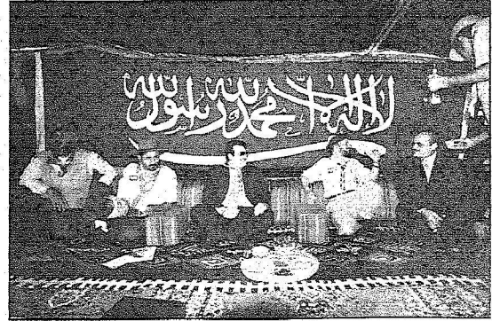
الأمير محمد خلال افتتاحه الجناح