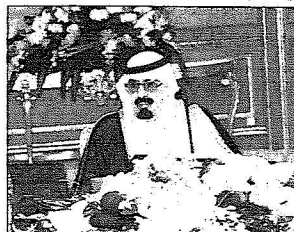
خادم الحرمين الشريفين خلال ترؤسه جلسة مجلس الوزراء أمس

كما رحب المجلس بإعلان دوشنبه الذي صدر في ختام أعمال الدورة السابعة والثلاثين لمجلس وزراء الخارجية بمنظمة المؤتمر الإسلامي وما تضمنه من إبداء للإرهاب وقاهرة الكرامة للإسلام والتميز المنهجي ضد للمسلمين ودعوته للمجتمع الدولي ومجلس الأمن لتحمل مسؤولياته