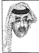
الأمير فيصل بن عبدالله

وتضمن نائب رئيس موهبة لخادم الحرمين الشريفين، رئيس المؤسسة، على رعايته لهذا الحدث المهم الذي يعني الكثير لمجتمع الموهبة والإبداع في المملكة، والذي يمثل علامة فارقة في تحول