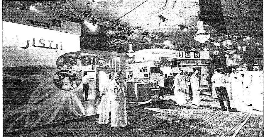
زوار يتجولون في جناح أرامكو السعودية في معرض «ابتكار ٢٠١٠» في جدة أمس.