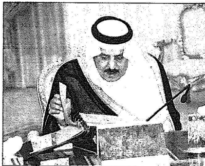
الملك الثاني خلال جلسة مجلس الوزراء أمس.

إلى ذلك، أطلع خادم الحرمين الشريفين المجلس على المشاورات واللقاءات والاتصالات التي جرت في الأيام الماضية، ومنها لقاءه بقيادة ورؤساء وفود دول مجلس التعاون الخليجي في اجتماعهم التشاوري الـ ١٢ الذي عقد في مدينة الرياض الثلاثاء الماضي، والمباحثات التي جرت حول مسيرة