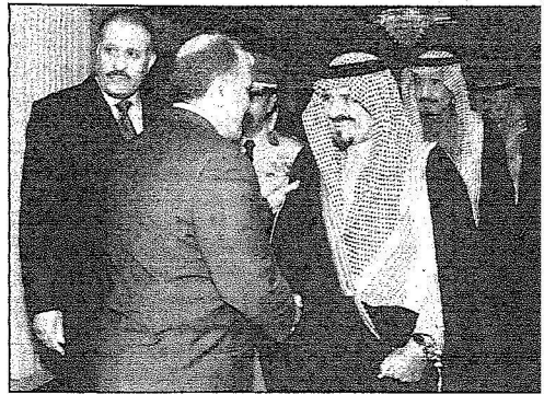
سعو ولي العهد خلال لقائه لاجتماعين