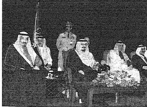
ولي العهد خلال لقائه لاجتماعين السعوديين ولى جواره الأمير سلمان