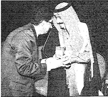
الأمير سلمان وحديث مع د. محمد العيسى