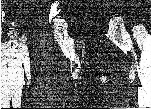
الأمير سلطان يحيي الحضور