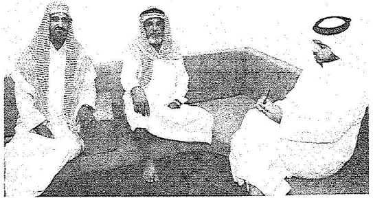
مستفيدين من المكرمة يتحدثون لهعكاظ

متهالكا وينذر بالسقوط في أي لحظة ولهذا كانت فرحتي غير عندما بشرني مندوب مؤسسة الملك عبدالله لوالديه للاسكان التسنوي بانني ضمن قائمة المستفيدين من المشروع. وكنت قد اضميت حوالى سنتين في مسكن آخر مستاجر على نفقة المؤسسة الى حين اكتمال المنزل الجديد. وبعدها جاءت الفرحة الكبرى حينما تسلمت مفاتيح السكن الجديد والذي سيكون لهذا العيد طعم آخر في أروقتي حينها انهرت دموعي فرحا.