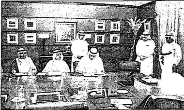
■ تصوير - فتيحي كالي

حتى الربط مع طريق السيل - طريق مكة - الطائف - السيل وبالتالي يصير النقل للمقبل وكحل من الدائري الأوسط بتكتمل بإذن الله، والذي وقع هذا اليوم المرحلة الأولى بطول (6) كم (472) مليوناً تحتوي على ثقل طويل طوله حوالي 450 متراً طوله، ما بين طريق جدة وطريق مكة للديانة المنورة - المرحلة الثانية إذا اعتمدت بإن شاء الله في ميزانية العام للمقبل سوف تحتوي على ثقل آخر وترتبط مثل ما ذكرت طريق الهجرة - بطريق السيل بطريق مكة الطائف عن طريق الكرى أما فيما يخص المشروع الثاني فهو استكمال طريق بقيق - الظهران