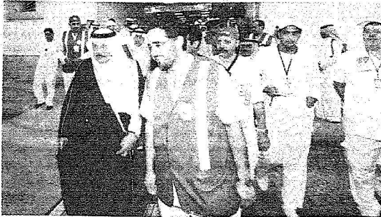
سعود بعد افتتاحه مستشفى التمة