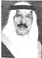
الأمير محمد بن ناصر

وبين سموه في تصريح صحفي ان من أبرز تلك القرارات التي اقرها مجلس الوزراء في