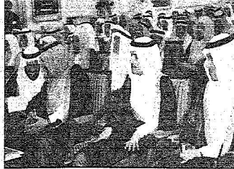
جانب من الحضور وفي مقدمتهم سمو الأمير محمد بن نايف