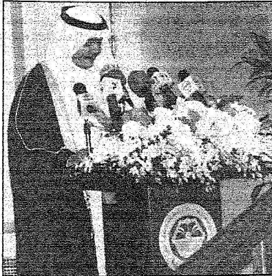
أمين عام الجائزة متفياً كلمة وتالياً أسماء الفائزين

الله التوفيق والسداد وأشكر أخواني الحضور على هذه المشاركة وعلى هذا الحضور الكريم وارجو أن يوفقنا الله جميعاً في هذا الوطن لما فيه الخير لديننا وديننا وإن نجفنا الله من عنده وبقينا من عنده فليس فوق قوة الله قوة مهما كانت القوة ستتمسك بيده العظيمة كما قلت قولاً وعملاً وديتوراً ونهجا ولو خسرتنا أنفسنا كلها في سبيل الله ثم في سبيل هذا الدين الكريم.