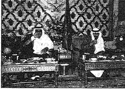
خادم الحرمين يقم مائدة إفطار لسمو أمير قطر