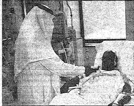
الجزيرة تعاهد للمرضى