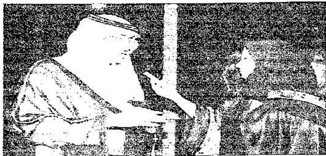
الامير عبد الله بن سعود يتحدثا لجمعية القابري في معرض شباب وشباب الاعمال الثالث البارحة في جدة

ايام ما يتحقق في شهر، ويحقق في أشهر ما يتحقق في سنوات. والدليل على ذلك هو ما يتحدث عنه العالم أجمع اليوم وتحدثت عنه الصحافة والإعلام في كل أنحاء العالم عن هذه الخطوات الجريئة والوقبات العالية التي يقومها سيدي خادم الحرمين الشريفين وولي عهده الأمير سلطان بن عبد العزيز والنائب الثاني الأمير نايف بن عبد العزيز وزاد الأمير في كلمته للشباب والسيدات، لقد استعنته الثقة ليس لانفسك فقط، وإنما لوطنكم وامتمكم وتبرهنون هذا المساء كما هي عادتنا بانكم قادرين على بلوغ جميع الغايات، ولن اناج اذ وجدتم بعد بضعة