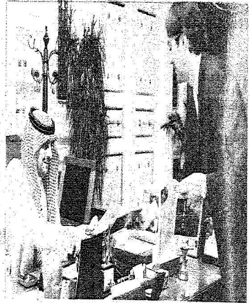
مدينة نيحة للبحر البريطاني