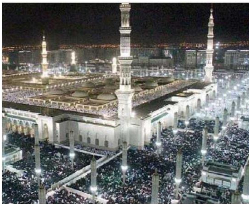
○ المسجد النبوي كما بدأ أمس الأول. ○