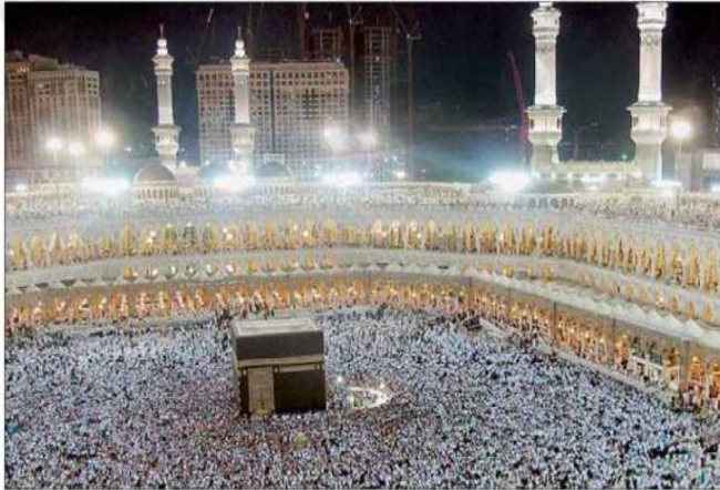
○ الحرم المكي كما بدأ البازحة الأولى ○