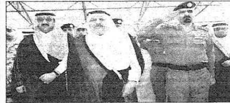
الأمير نايف يقف على استعدادات القوات المشاركة بشؤون الحج - عسبة - محسن سالم