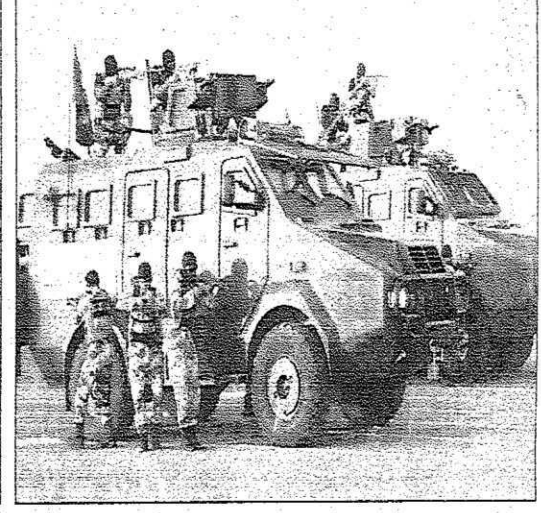
جانب من العرض