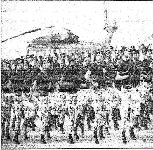
عرض الأليات والقوات المشاركة