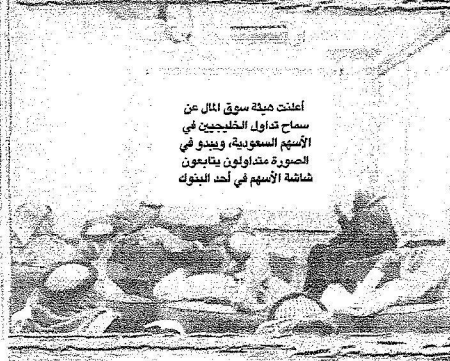
أعلنت هيئة سوق المال عن سماح تداول الخليجيين في الأسهم السعودية، ويبدو في الصورة متداولون يتابعون شاشة الأسهم في أحد البنوك