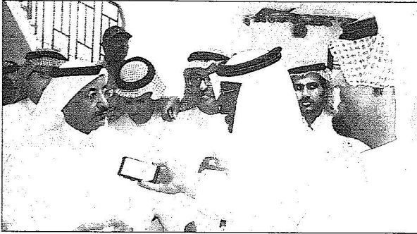
الوزير يتحدث لـ (اليوم)

إلزام شركة النقل الجماعي بتوفير سكن لذوي الضحايا وفود من السفارات تطمئن على المصابين وتتلقى العزاء