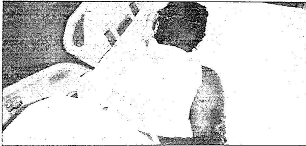
أحد المصابين بالحافلة

الذين تجاوز عددهم 17 مصابا، وكذا جثث المتوفين الذين تجاوز عددهم 28 متوفيا.