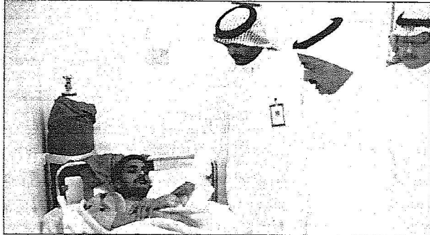
.. ويطمئن على المصابين

النقل إنه استدان قيمة سفره من جازان السليل « لم يتم التعرف على هويات الجثث والبالغ عددها 28، حيث إن جميعها متفحمة