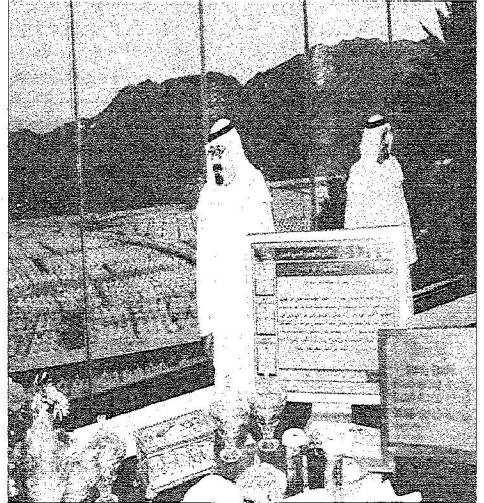
خادم الحرمين لدى وصوله من رأس جاز إلى الأمير مشعل بن عبدالعزيز