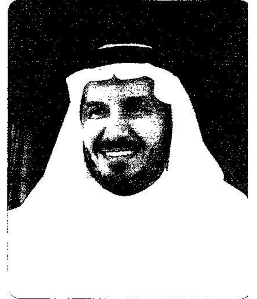
وزير الصحة د. عبدالله بن عبدالعزيز الربيعه

لتعامل مع التجمعات والحشود البشرية خلال مواسم العمرة والحج كما يهدف إلى استعراض تجربة المملكة العربية السعودية لموسم الحج كونها تجربة فريدة من نوعها على اعتبار أنها تدير أكثر من مليوني حاج في نطاق جغرافي ورمزي محدد مما جعلها مثالا يحتذى به. ويحظى هذا المؤتمر بحظى باهتمام ومتابعة مباشرة من معالي وزير الصحة