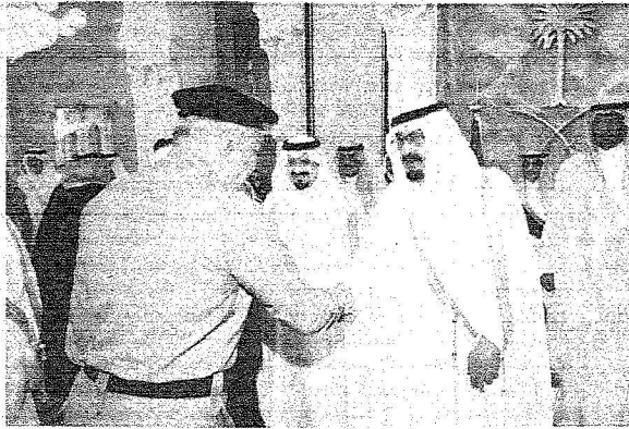
خادم الحرمين الشريفين خلال استقباله بح قصر منى أمس الأمراء والعلماء والمشايخ والوزراء وقادة وضباط ومنسوبي أمن الحج الذين هنأوه بعيد الأضحى المبارك.