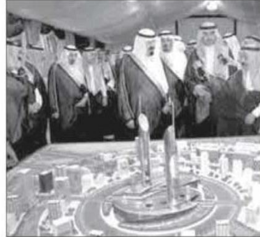
مخطط المدينة الاقتصادية