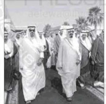
من الزيارة الجعونة للملك لحائل

فرحة حائل بتمديد خدمة أميرها المحبوب تفتح أبواب الأمل مجدداً