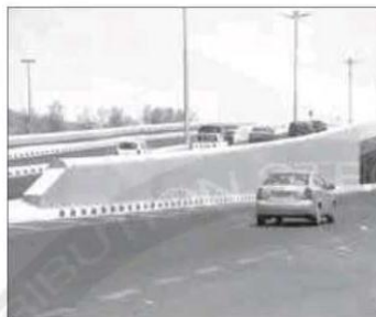
من مشاريع الأمانة