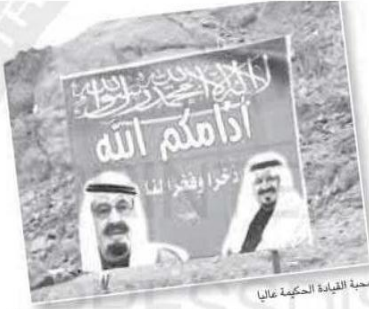
حمية للقيادة الحكيمة عاليا