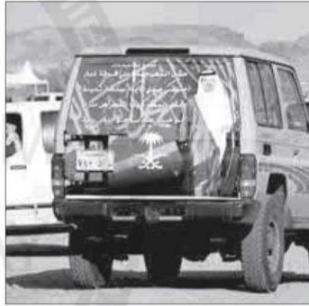
أمير حائل في القلوب