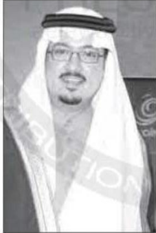
الشيخ عبدالله بن خالد