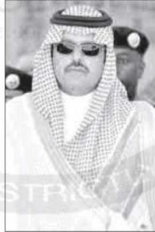
نائب أمير حائل