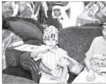
براعم من حائل