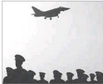
من كلية الملك فيصل