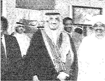
رئيس السودان عمر البشير في لحظة تذكارية مع الأمير نواف بن فيصل تقليده وسام النبيلين.