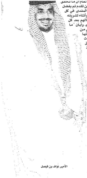
الأمير نواف بن فيصل

وأوضح نائب الرئيس العام ان ما حصل لقطاع الرياضة والشباب من تقدم تم بفضل الله ثم بتوجيهات الملك المفدى في كل مناسبة رياضية وشبابية، وأثناء تشریفه لأبنائه الرياضيين باستقبالهم بعد كل إنجاز يحققونه لوطنهم، وأبان ما حققه القطاع الرياضي من حضور بلادنا ورفع رايتهما الغالية على المستويات القارية والدولية لم يتحقق إلا بهذه الرعاية المباشرة الكريمة من لدن خادم الحرمين الشريفين، والأمير سلطان بن عبد العزيز ولي العهد نائب رئيس مجلس الوزراء وزير الدفاع والطيران والمفتش العام، وأضاف: إن ثقة خادم الحرمين ولي عهد الأمين ستكون دافعا للمزيد من العمل والإنجازات بمشيئة الله تعالى في مسجال الرياضة والشباب ويمتابة وتوجيه الأمير سلطان بن فهد الرئيس العام لرعاية الشباب ومواصلة شرف خدمة بلادنا الغالية في هذا العهد الزاهر اليمينون.