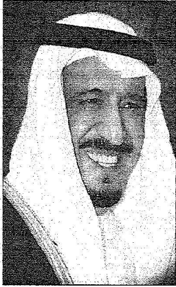
سمو أمير منطقة الرياض