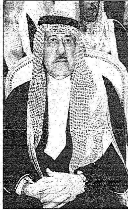
سمو نائب أمير منطقة الرياض