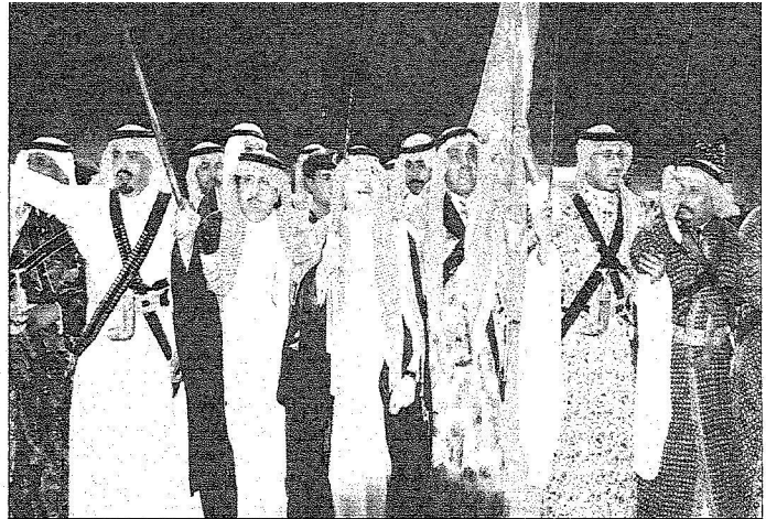
الأمير سلطان يشارك في العرضة