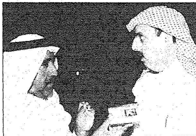
أل مقرن يتحدث للزميل المسيحي

العربية والخليجية والإسلامية إضافة إلى الدول الصديقة، وبين سمو الأمين آن احتفالات الألعاب التارية هذا العام ستقام في مدينة الرياض ككل، مشيراً إلى جهود الأمانة لتنويع الاحتفالات لتلبي رغبات كافة الشرائح والفئات. وأوضح أمين منطقتي الرياض أن صاحب السمو الملكي الأمير سلمان بن عبدالعزيز أمير منطقة الرياض وجهه من اليوم الأول لبدء احتفالات الأمانة بالأعياد بتشكيل لجنة عليا لاحتفالات العيد مهمتها وضع برنامج