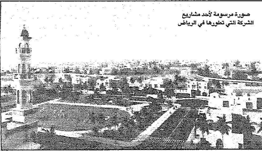
صورة مرسومة لجدد مشاريع الشركة التي تعهدها في الرياض

وتوقع الرئيس التنفيذي للشركة الأولى بناء نحو ٢,٣ مليون وحدة سكنية حتى العام ٢٠٢٠ وبمعدل ١٤٥ ألف وحدة سكنية سنوياً، وبحجم استثمارات يصل إلى تريليون ريال، فيما سيؤدي النمو الحاصل في القطاع السياحي والافتتاح الذي شهده المملكة للترويج للسياحة غير الدينية إلى جانب النمو في السياحة الدينية نفسها إلى مساهمة السياحة بنحو ٨٢ مليار ريال من الناتج المحلي السعودي في العام ٢٠٢٣.