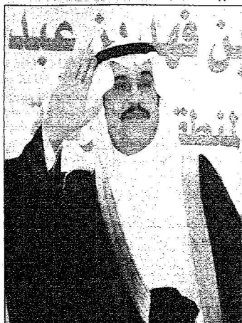
الأمير محمد بن فهد

قفزت جامعة الأمير محمد بن فهد الأهلية بالمنطقة الشرقية ✦ عبدالرزاق السنوسي - الفر لتخطف الأضواء من منافسيها في الوطن العربي والعالم على الرغم من الزمن القصير الذي وأكب التخطيط لمراحل تأسيسها، حيث باتت مضرب الأمثال في الأوساط الأكاديمية وحديث الصناعة الأكاديمية الحديثة كرائدة نموذجية في عنايتها بالعلوم المتقدمة والعلوم الأخرى التي تؤهل القياد السعودي للعمل في كل أنحاء هذه البلاد. ومنذ الوهلة الأولى لم يتوقف الحديث عن هذا الصرح العملاق لكون الكلمات التي سطرها صاحب السمو الملكي الأمير سلمان بن عبدالعزيز أمير منطقة الرياض في التاسع والعشرين من ابريل 2006م وهو يصنع بيده الكريمة حجر الاساس لهذه لجامعة كانت ترسم الصورة الواقعية لمستقبل التعليم الجامعي البراق من خلالها حيث قال سموه يومها: (لاشك ان عملا مثل هذا ومشروعا قيما مثل هذا وانشاء جامعة تعنى بالعلوم الحديثة والعلوم التي تؤهل شبابنا للعمل في كل أنحاء هذه البلاد لهو عمل جليل وعمل رائد ولاشك ان الجهد والمبادرة اللذين قام بهما الامير محمد بن فهد واخوانه في هذه المنطقة لهو جهد مشكور وجهد معلوم لخدمة المنطقة والبلاد وليس غريبا على الامير محمد بن فهد ان يسعى هذا السعى فولاهه الملك فهد رحمه الله هو رائد التعليم الحديث في هذه البلاد ونيس من الفريق على ابنه ان يكون كذلك.) (اليوم) التقت بالكتور عيسى بن محمد الانصاري مدير جامعة الامير محمد بن فهد الأهلية بمناسبة صدور النظام الاساسي للجامعة الذي كلفته موافقة خادم الحرمين الشريفين الملك عبدالله بن عبدالعزيز على انشائها.. حيث يستعرض الدكتور الانصاري هنا النظام الاساسي بتفاصيله الدقيقة: