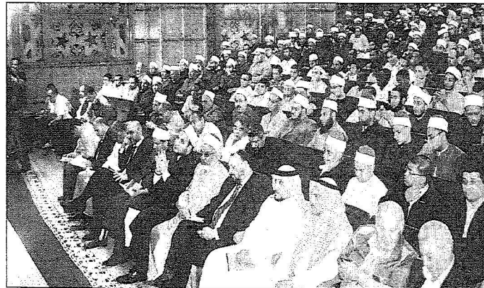
علماء ودعاة حضروا ندوة القيم الإسلامية في جامع لنور في القاهرة.