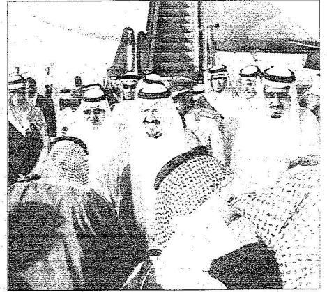
الأمير سلطان الذي وصّله نحات الرضا أمين (أيس)