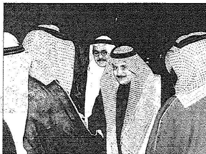
سموه بصافح مستقبله