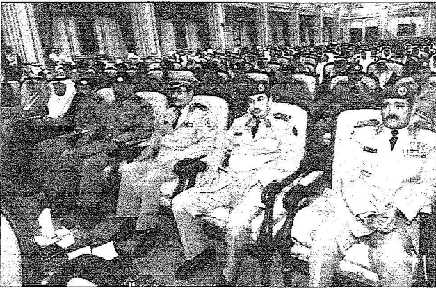
عدد من المسؤولين العسكريين والمدنيين الذين حضروا الاستقبال