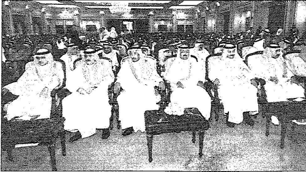
جانب من الأمراء والمسؤولين الذين حضروا الاستقبال