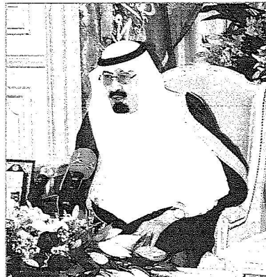
الملىك بىخاطب وىء قىبىلى الرادى